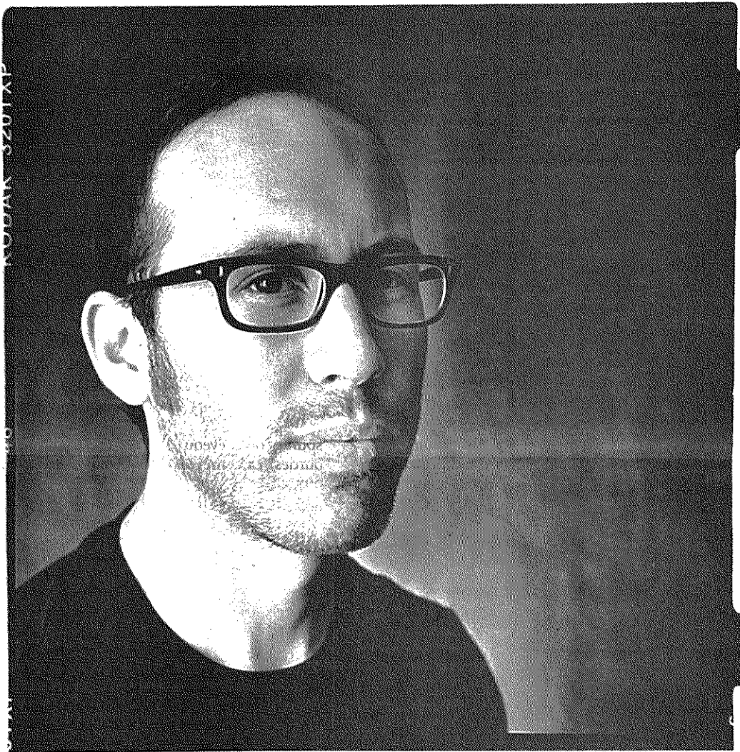
Yaron Herman. Le pianiste israélien, né en 1981, a commencé le piano à l'âge exceptionnellement tardif de 16 ans. «Je n'imaginai pas que la musique prendrait une telle place. Elle m'a révélé à moi-même.»

Carte blanche autour de Ravel par Yaron Herman, ce soir à 21h au château de Chillon. www.montreuxjazz.com